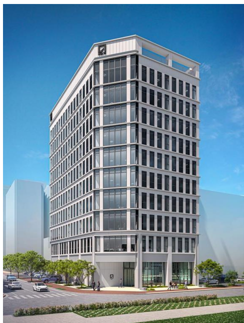
沖縄おもろまちオフィス外観 (イメージ)