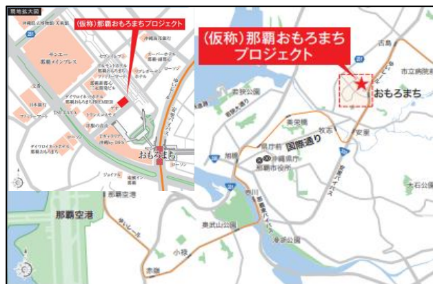
沖縄おもろまちオフィス開発計画