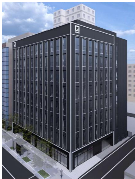
博多駅東オフィス外観 (イメージ)