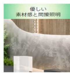
新しいデザインコードの例