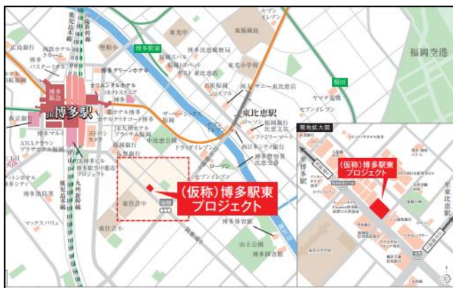
博多駅東オフィス開発計画