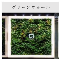
コアデザインコードの例

従来のデザインには、視認性の高いブランドサインを囲む「グリーンウォール」や間接照明などの「光の演出」、EV ホールなどで情報発信する「デジタルサイネージ」などがありました。これらに加わる新しいデザインコードとして、待ち時間に癒しを与える「グリーンラウンジ」、パソコンでちょっとした作業を可能にする「タッチダウンスペース」、地域を活かした「リージョナルデザイン」、音や匂いで「五感」を刺激する仕掛け、有機的で「優しい素材感」などを導入し、時代にあわせてアップデートします。