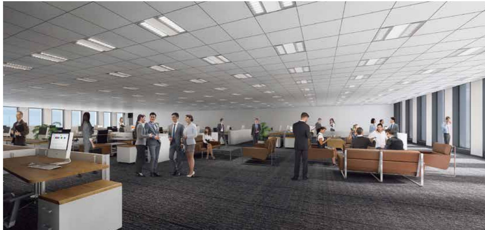
Refreshing space [リフレッシュコーナー]

The complete pillar-free space by exoskeleton structure enabled to realize open and flexible office space. It promotes the productivity of business, and allows your company to move forward even further.