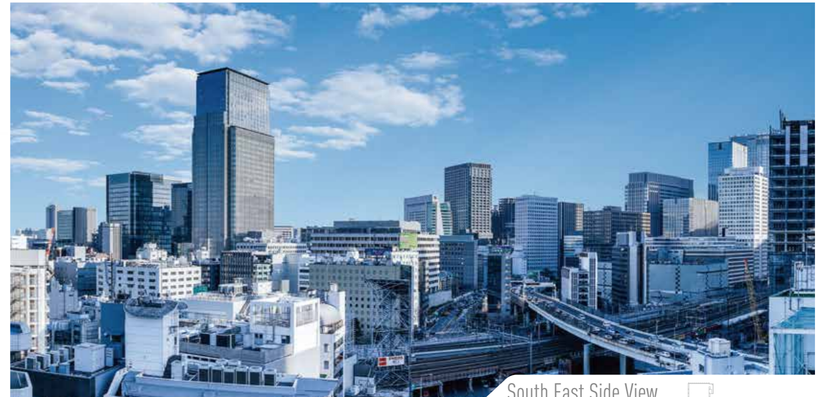
South East Side View